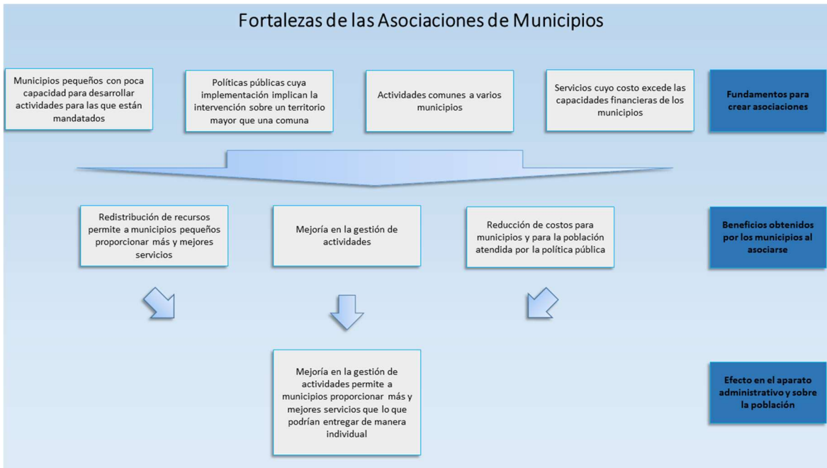
Esquema 3. Las Asociaciones de Municipios, aun en los casos en que su incidencia ha sido marginal, han sido exitosas en la redistribución de recursos y en entregar a los municipios la posibilidad de desarrollar actividades que de otro modo serían imposibles o muy dificultosas. Así, el resultado de las asociaciones ha sido siempre permitir una mejoría en los